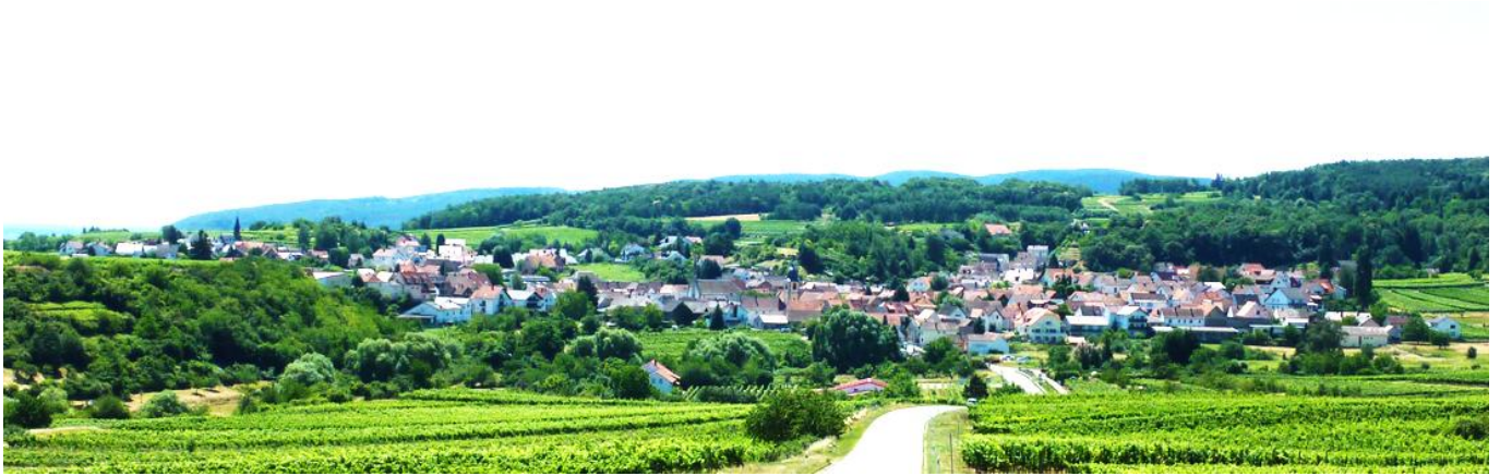
v.i.S.d.P.: Protestantischer Kirchbauverein Leistadt e.V., Axel G. Günther, In den Weiden 2, 67098 Bad Dürkheim - Leistadt